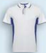
0105 Blanco Royal