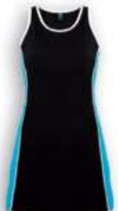
0212 Negro Turquesa