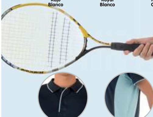
Detalle abotonadura con tapeta y cuello contrastatada