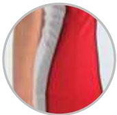
Detalle contraste costado.