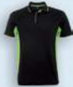
02225 Negro Lima