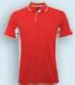
6001 Rojo Blanco