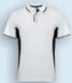
0102 Blanco Negro