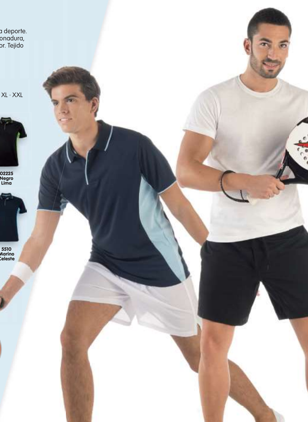
Detalle costura y contraste lateral