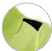
Detalle hombro con contraste