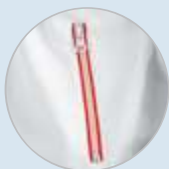
Detalle bolsillo lateral