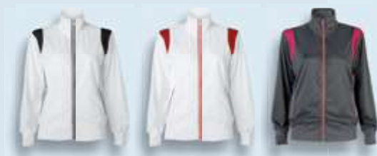
0102 Blanco Negro