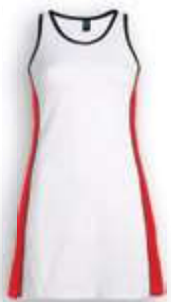
0160 Blanco Rojo