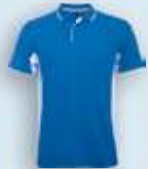
0501 Royal Blanco