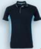
5510 Marino Celeste