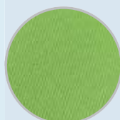
Detalle muestra tejido