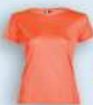
224 Fucsia Flúor