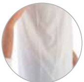
Detalle diseño lateral