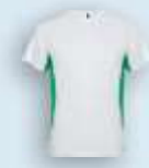
0120 Blanco Verde Kelly