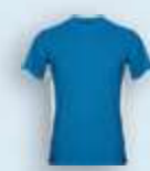
0501 Royal Blanco