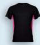
0240 Negro Fucsia