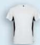
0102 Blanco Negro