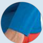
Detalle remallado en mangas