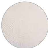
Detalle tejido transpirable