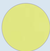
Detalle muestra tejido