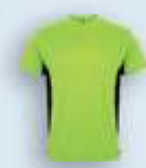
22502 Lima Negro