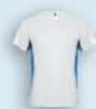
0105 Blanco Royal