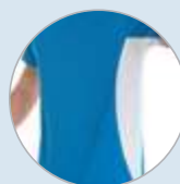
Detalle costura y contraste lateral