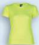
221 Amarillo Flúor