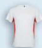
0160 Blanco Rojo