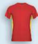
6003 Rojo Amarillo